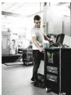
Wera 2go 4 Kapsa na nářadí